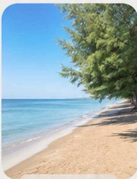
บรรยากาศร่มรื่น