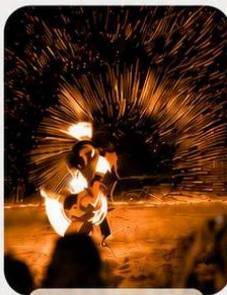
โชว์ควงกระบองไฟ